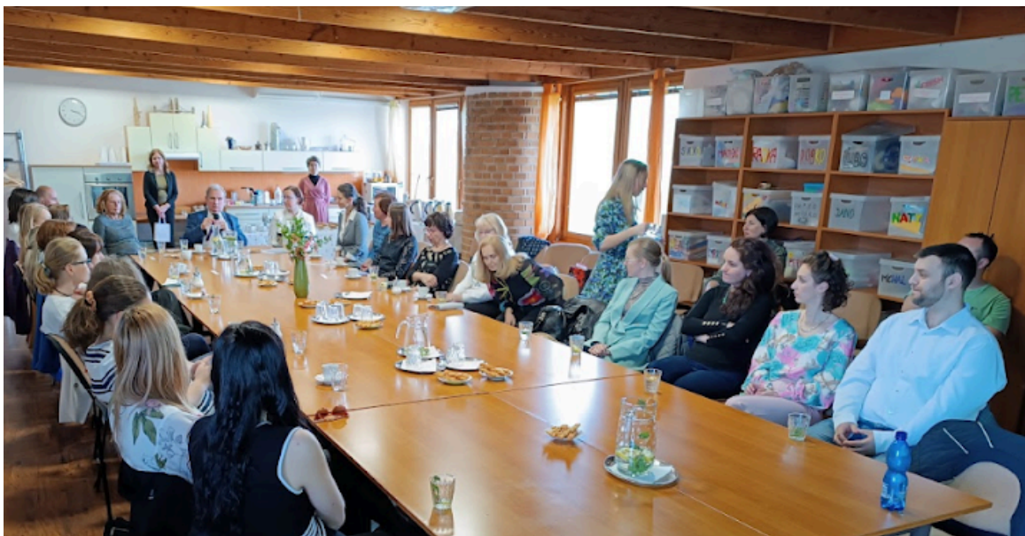
Fotografia 10 - diskusia

V záverečnej časti programu bol vyhradený priestor na diskusiu. Diskutovalo sa o nových trendoch, formách a metódach v liečebnej rehabilitácii, zavádzaní roboticky asistovanej rehabilitácie, umelej inteligencie - ich výhodách i možných úskaliach. Vymieňali sa skúsenosti s predpismi zdravotníckych pomôcok a vykazovaním zdravotnej starostlivosti poisťovniam. V diskusii sa spomenuli taktiež metódy založené na prítomnosti zvieratiek - animoterapia, najmä canisterapia a hipoterapia. Niektorí účastníci zdieľali skúsenosti zo svojej praxe.