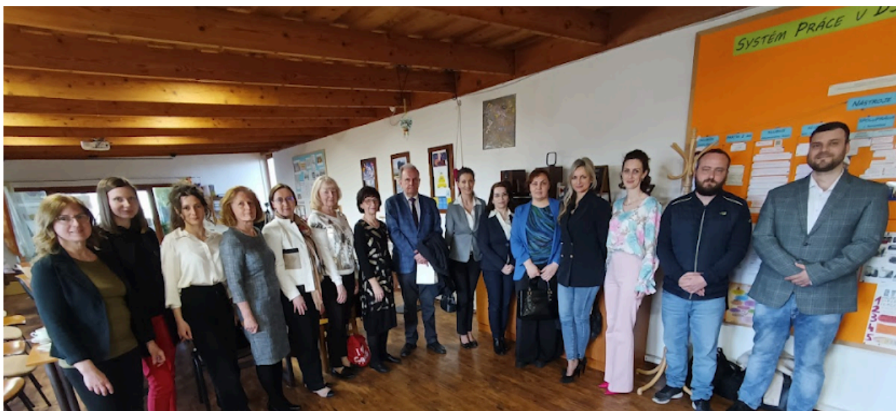
Fotografia 11 - spoločná fotografia

Ukončenie seminára prebiehalo v duchu radosti z osobných stretnutí, účastníci sa rozlúčili spoločnou spomienkovou fotografiou.